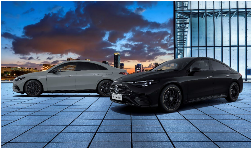
CLA 180 Launch Edition