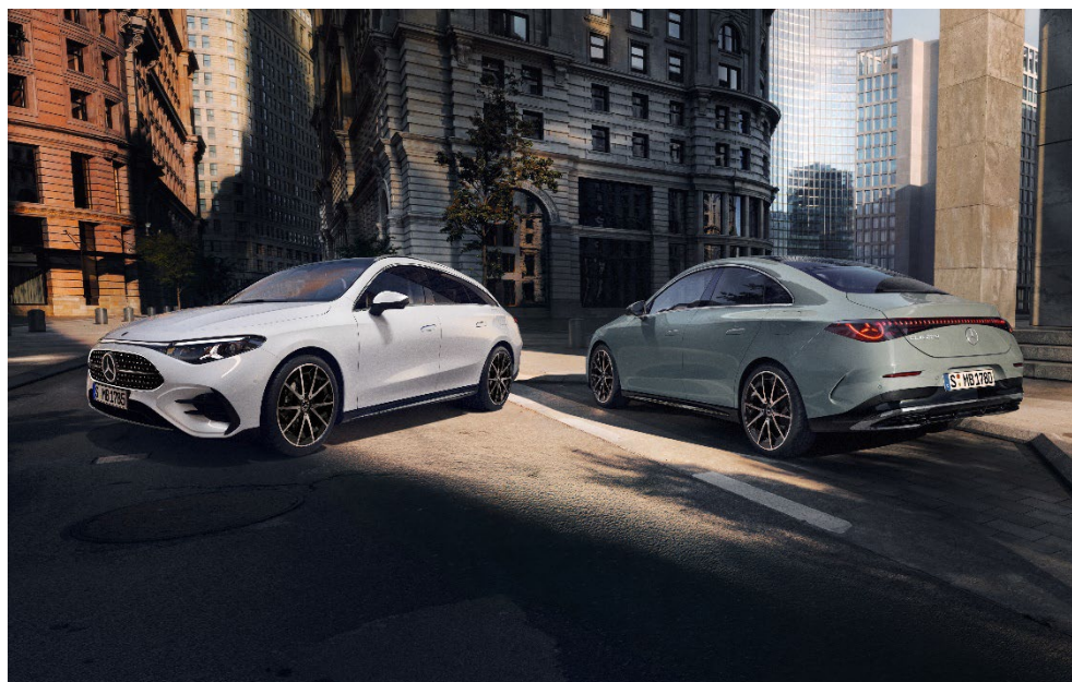
新型「CLA」、新型「CLA シューティングブレーク」

*12: 上記のメーカー希望小売価格は、付属品価格、税金(消費税を除く)、保険料、登録に伴う諸費用を含まない車両本体価格です。また、「自動車リサイクル法」に基づく、リサイクル料金が別途必要となります。メーカー希望小売価格は参考価格です。価格は販売店が独自に定めておりますので、詳しくは各販売店にお問い合わせ下さい。