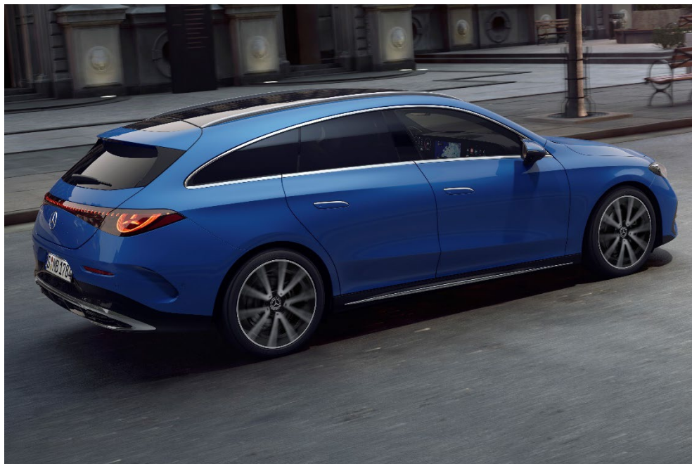
CLA 220 Shooting Brake

また、新型 CLA で初採用となり、標準装備される大型パノラミックルーフは、フロントウインドウフレームから後方までシームレスに広がるセンターブレースのない一体型固定式ガラスルーフを採用しています。上方への視界を大きく確保することで、室内にいつもの開放感と明るさをもたらすとともに、先代モデルと比べてよりゆとりのあるヘッドルームにも寄与しています。さらに、熱線を遮る合わせガラスに加え、外側に赤外線フィルム、内側に LowE コーティングを採用し、日射や熱の影響を低減しています。この設計によりローラーブラインドを不要とし、より開放的な室内空間になっています。