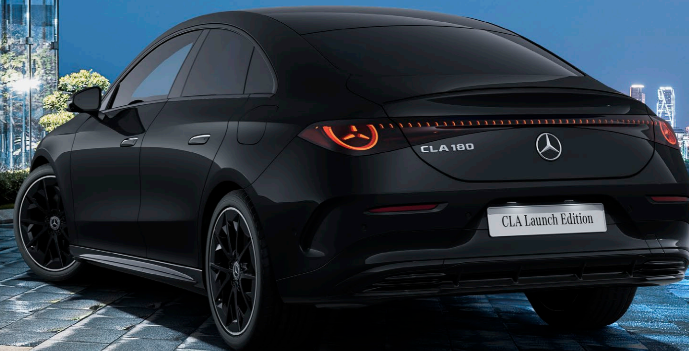
CLA 180 Launch Edition

※日本仕様のハンドル位置は右ハンドルとなります。写真の仕様・装備は、日本仕様と異なる場合があります。また、半導体供給不足に伴う生産制約によって、仕様・装備・メーカー希望小売価格が変更になる場合があります。詳しくはメルセデス・ベンツ正規販売店にお問い合わせください。