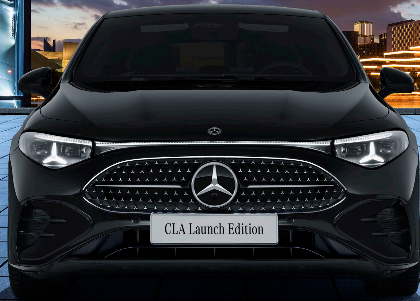
CLA 180 Launch Edition