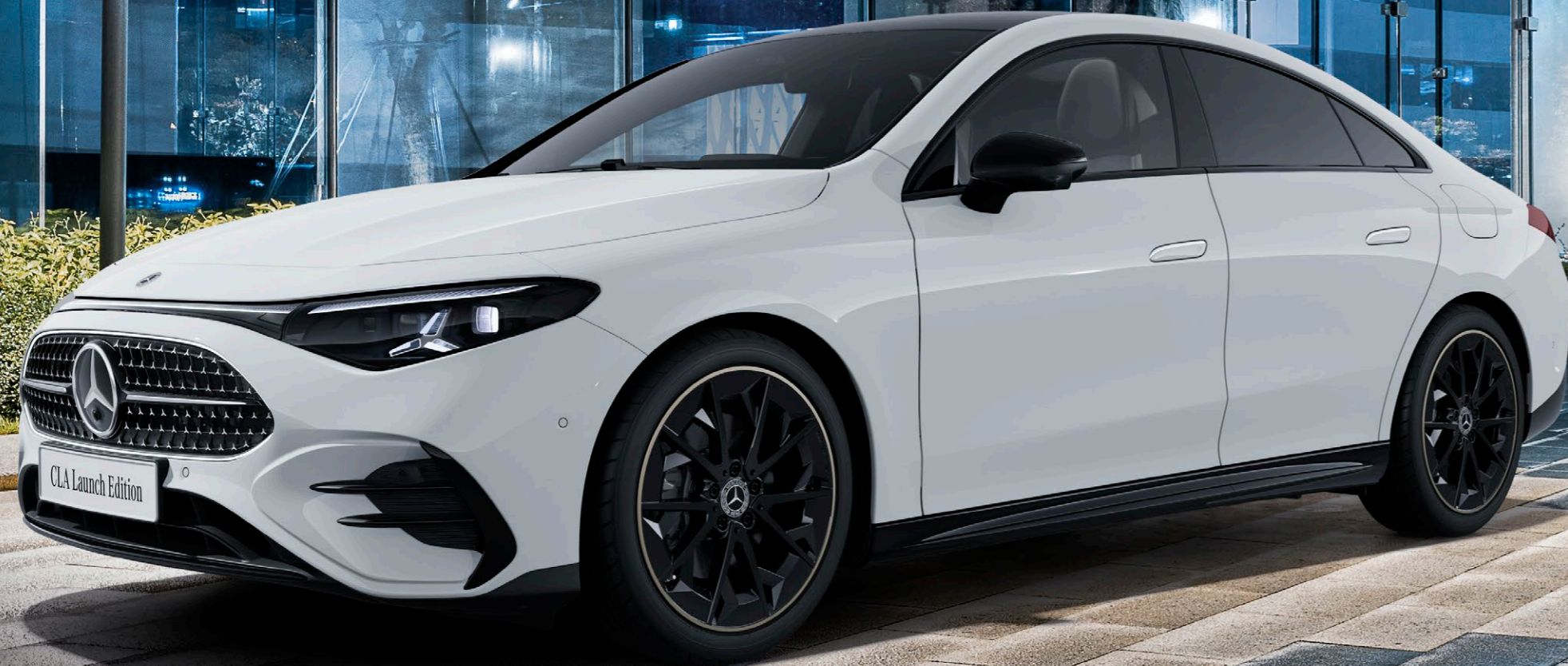
CLA 180 Launch Edition