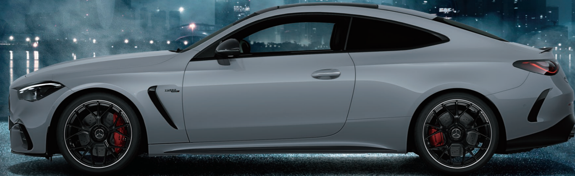
Mercedes-AMG CLE 53 4MATIC+ Coupé Edition Night Carbon (ISG)