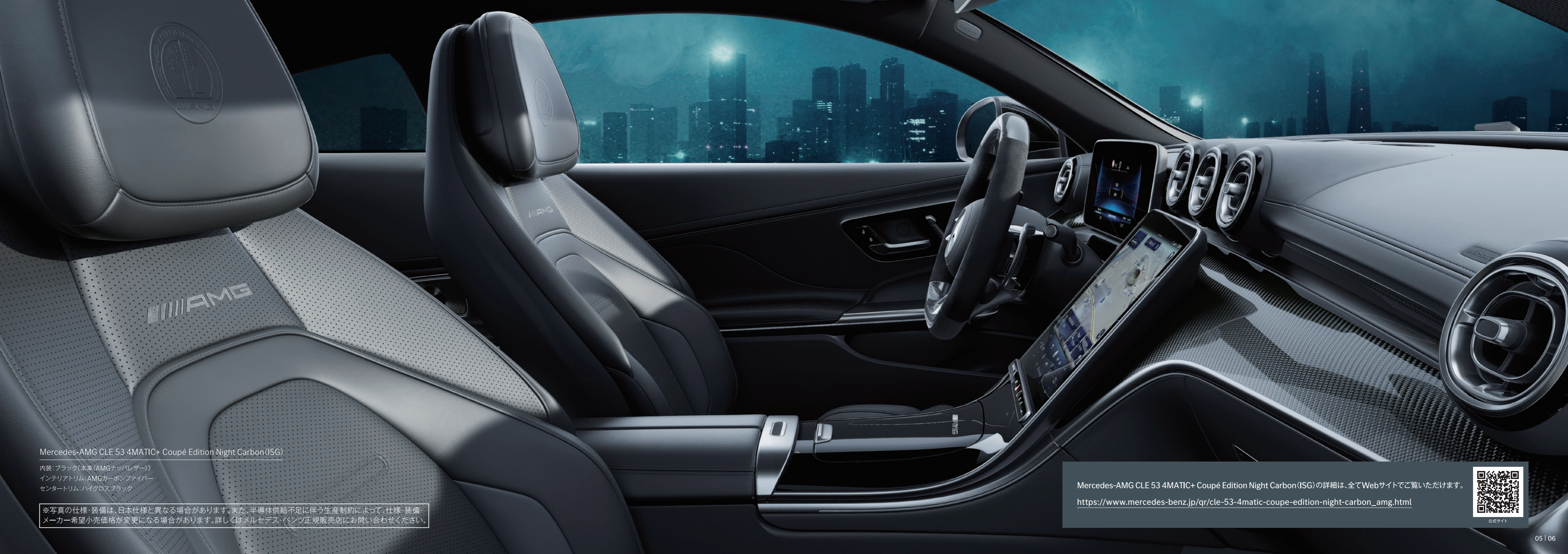
Mercedes-AMG CLE 53 4MATIC+ Coupé Edition Night Carbon (ISG)

内装：ブラック(本革 (AMG ナップレザー)) インテリアトリム：AMG カーボンファイバー センタートリム：ハイグロスブラック