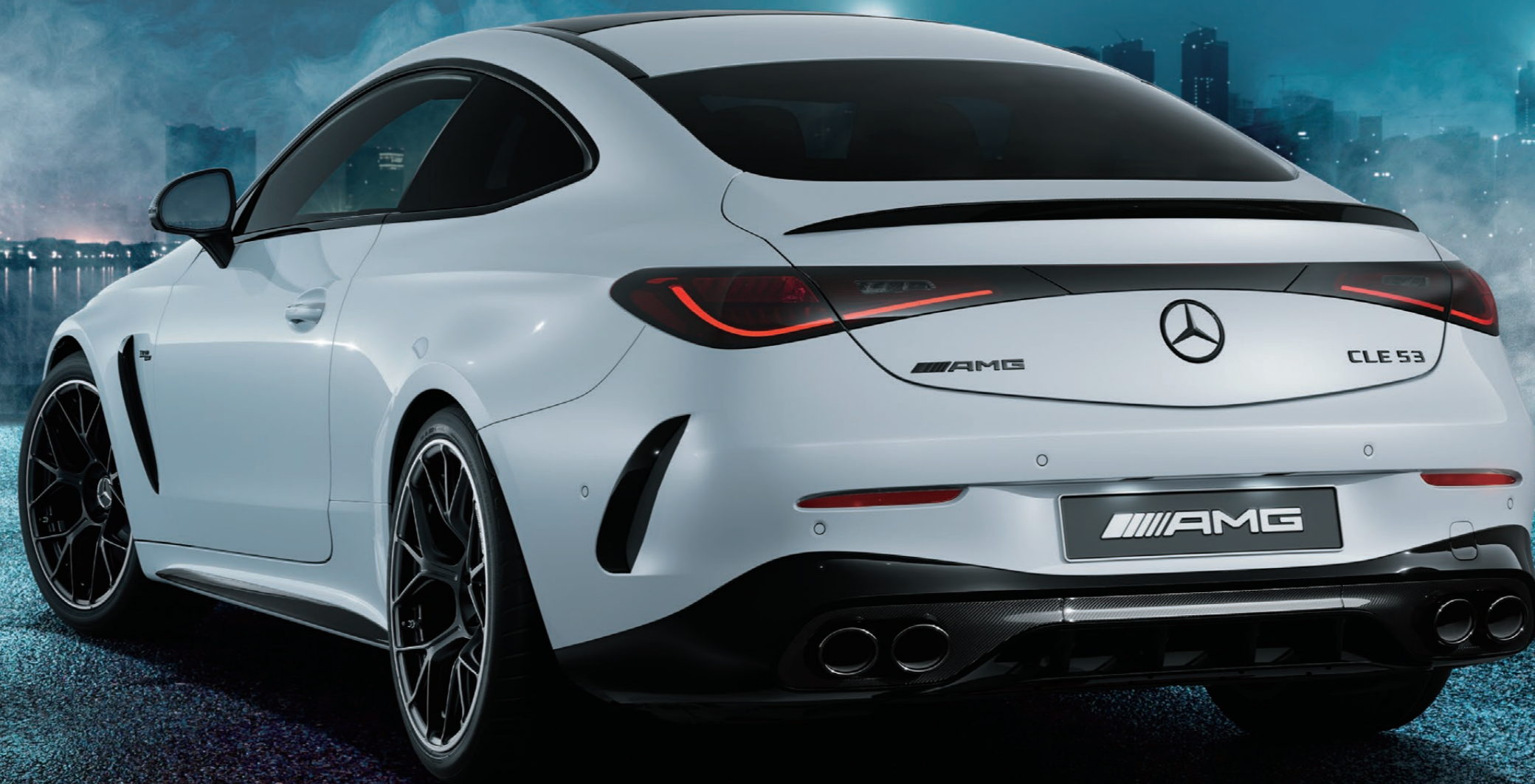
Mercedes-AMG CLE 53 4MATIC+ Coupé Edition Night Carbon (ISG*)