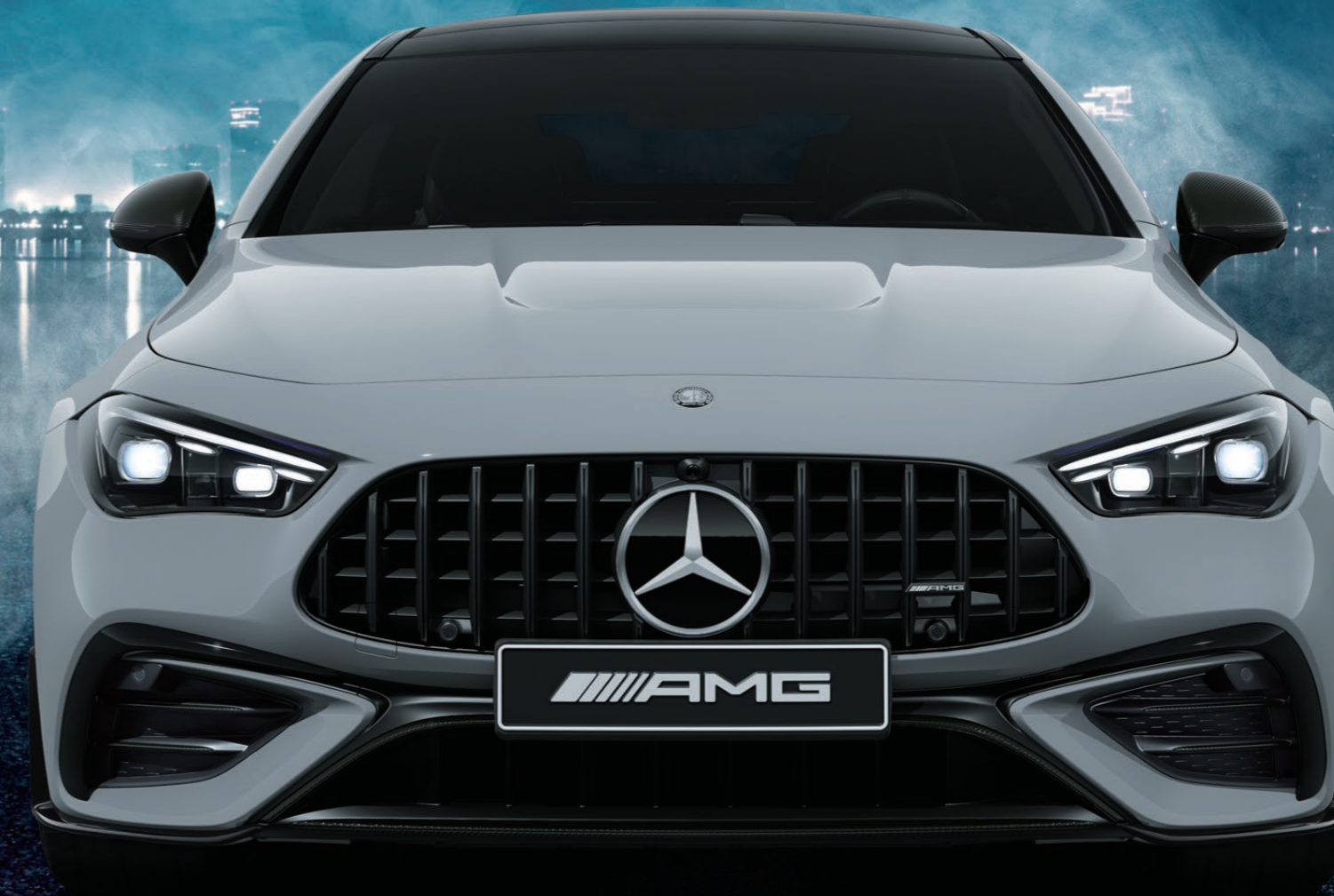
Mercedes-AMG CLE 53 4MATIC+ Coupé Edition Night Carbon (ISG)