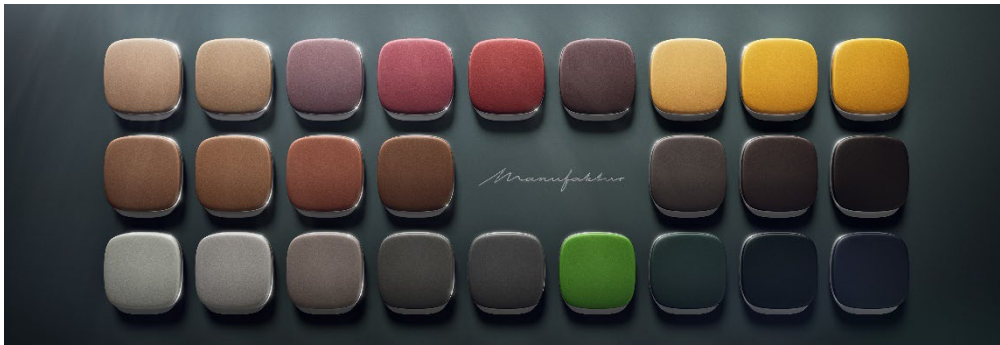
MANUFAKTUR インテリア色見本